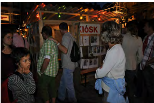
KIOSK -offspace Everybody a Terrorist in fives Minutes 11