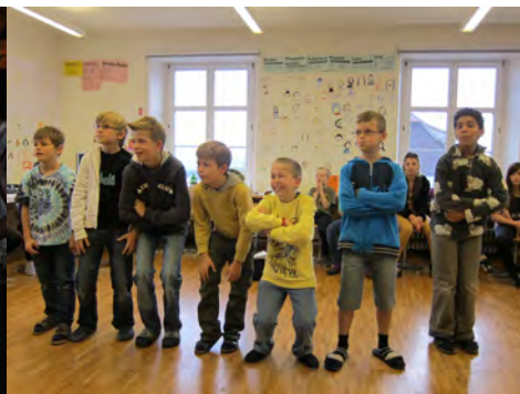
forming history Demokratische Kunstwochen Pfyn 11